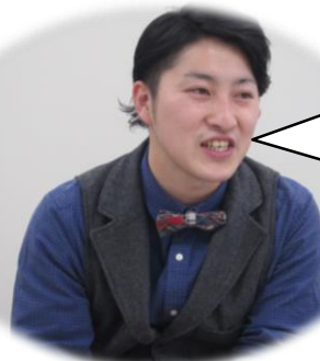
参加者の成長度合い

細かいところまで教えていただいて、今でもテキストを見直している。講師自身の言動からも、「本気とはこういうことだ」ということを教えてもらった。